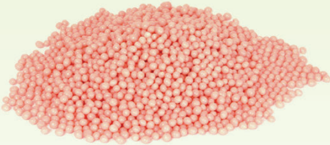
Frambuazlı Pirinç Patlađı