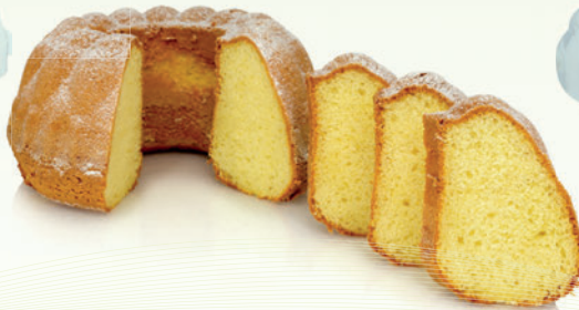
Hamur Kabartma Tozu