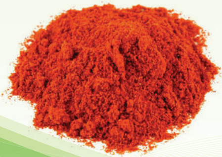
Kırmızı Toz Biber