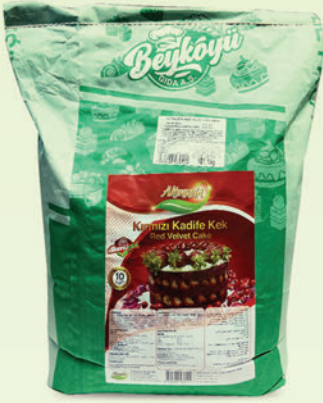
Red Velvet Toz Kek Miksi

Altınusta kek miksleri ile mükemmel lezzetle beraber yüksek hacimli, homojen gözenek yapısına sahip ve tazeliğinden ödün vermeyen standart ve pratik kekler elde edin! Özellikle Velvet Kek Mikslerinde kullanılan tüm renklendiriciler DOĞALDIR!