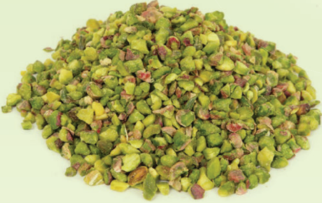
Pirinç Antep Fıstık