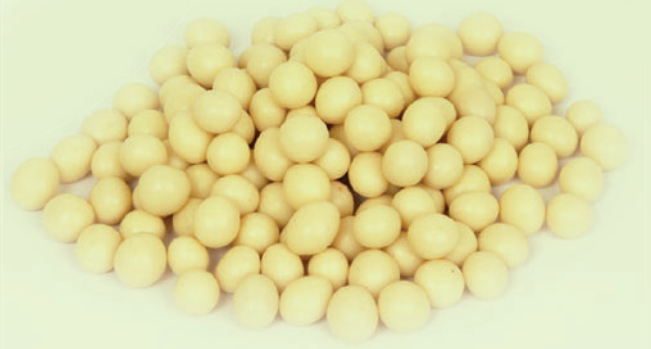
Frambuazlı Pikola Fındık Draje