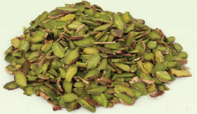
File Antep Fıstığı