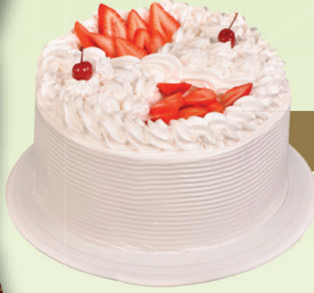
Krem Şanti Tozu