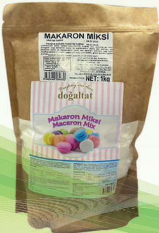
Makaron Toz Miksi