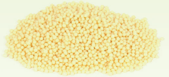
Fildiři Pirinç Patlađı