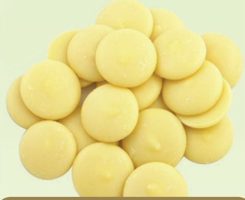
Fildişi Pul Çikolata