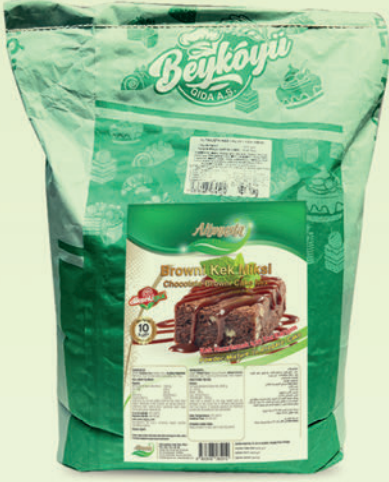
Browni Toz Kek Miksi