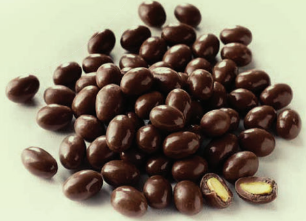
Bitter İnce Mat Fıstık Draje