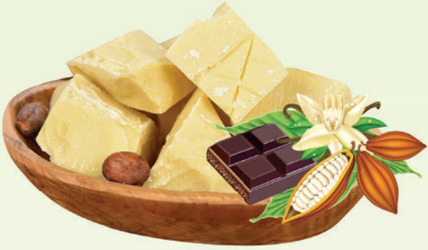
Kakao Yağı 1 Kg