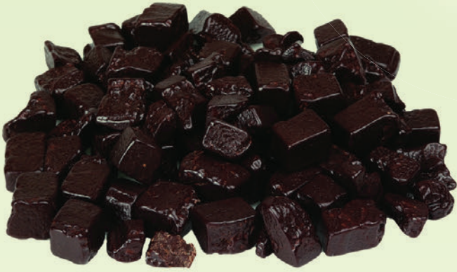
Bitter Parça Çikolata