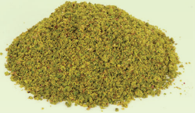
Antep Boz Toz Fıstık