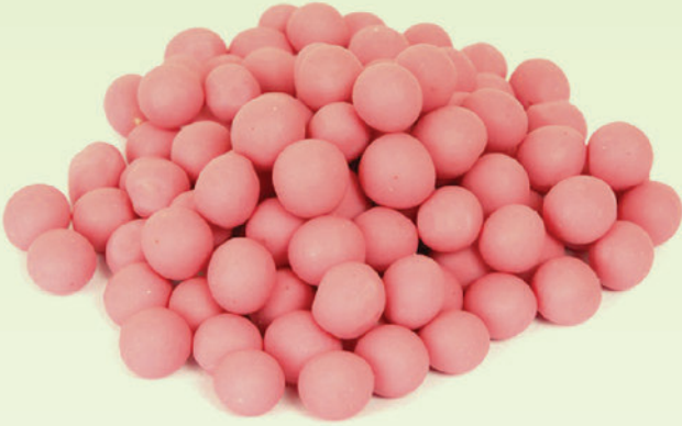
Fildişi Pikola Fındık Draje