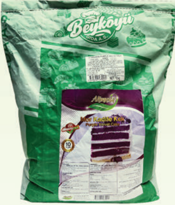
Purple Velvet Toz Kek Miksi