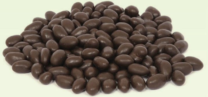
Bitter Klasik Mat Fıstık Draje