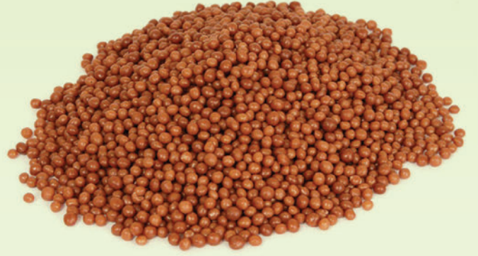
Sütlü Pirinç Patlađı