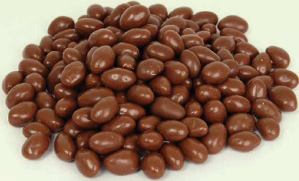
Sütlü Klasik Mat Fıstık Draje