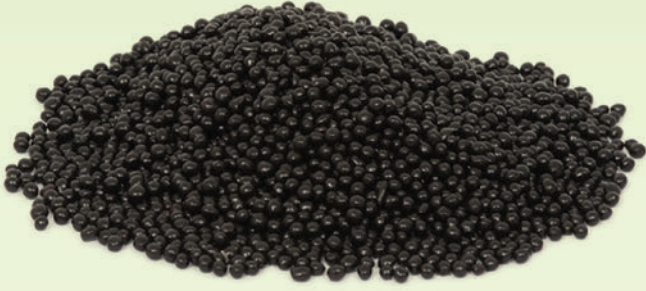
Bitter Pirinç Patlađı