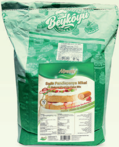
Pandispanya Toz Kek Miksi