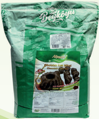
Çikolatalı Toz Kek Miksi