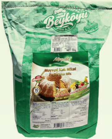
Meyveli Toz Kek Miksi