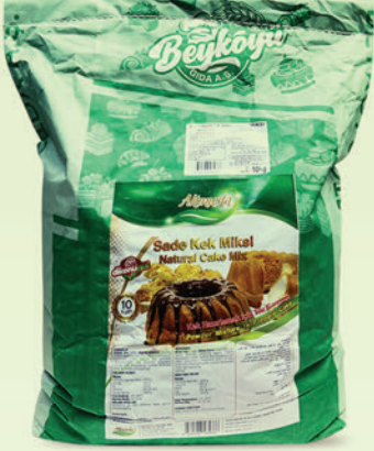
Sade Toz Kek Miksi