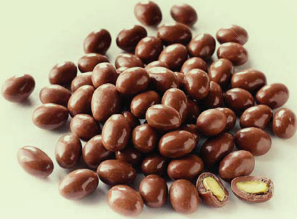
Sütlü İnce Mat Fıstık Draje