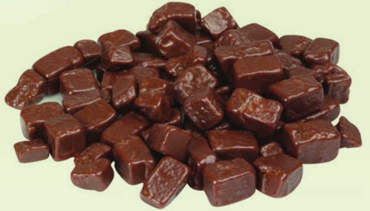
Sütlü Parça Çikolata