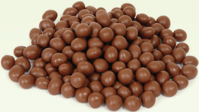
Sütlü Pikola Fındık Draje