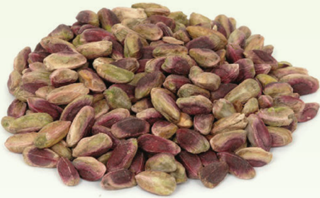
Antep Kırmızı İç Fıstık