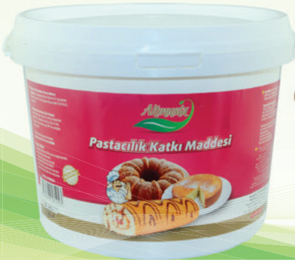
Pasta Katkı Maddesi