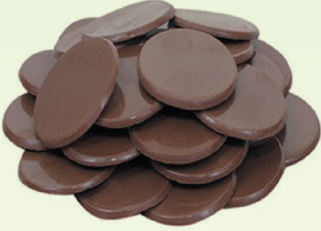
Sütlü Pul Çikolata