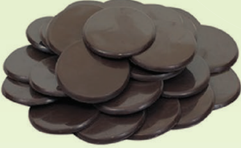
Bitter Pul Çikolata