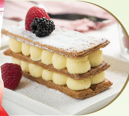
Krem Patisseri Tozu