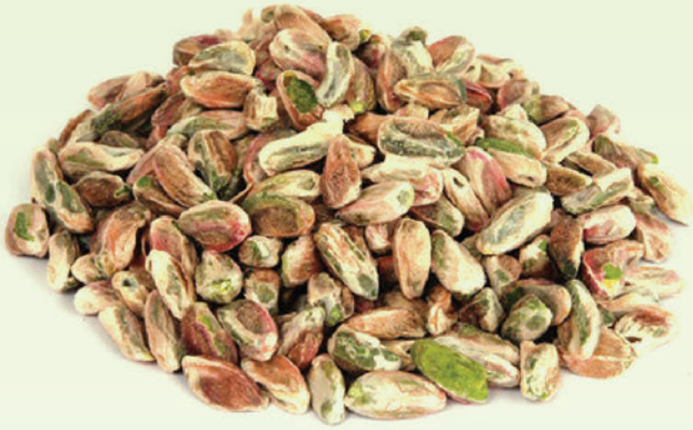
Antep Boz Bütün Fıstık