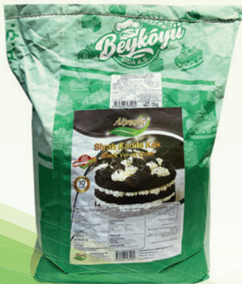
Black Velvet Toz Kek Miksi