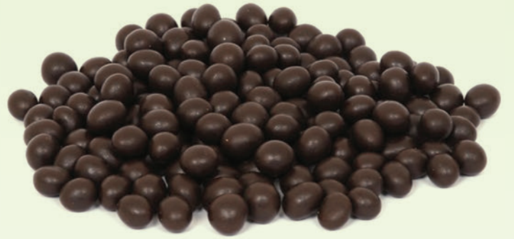
Bitter Pikola Fındık Draje